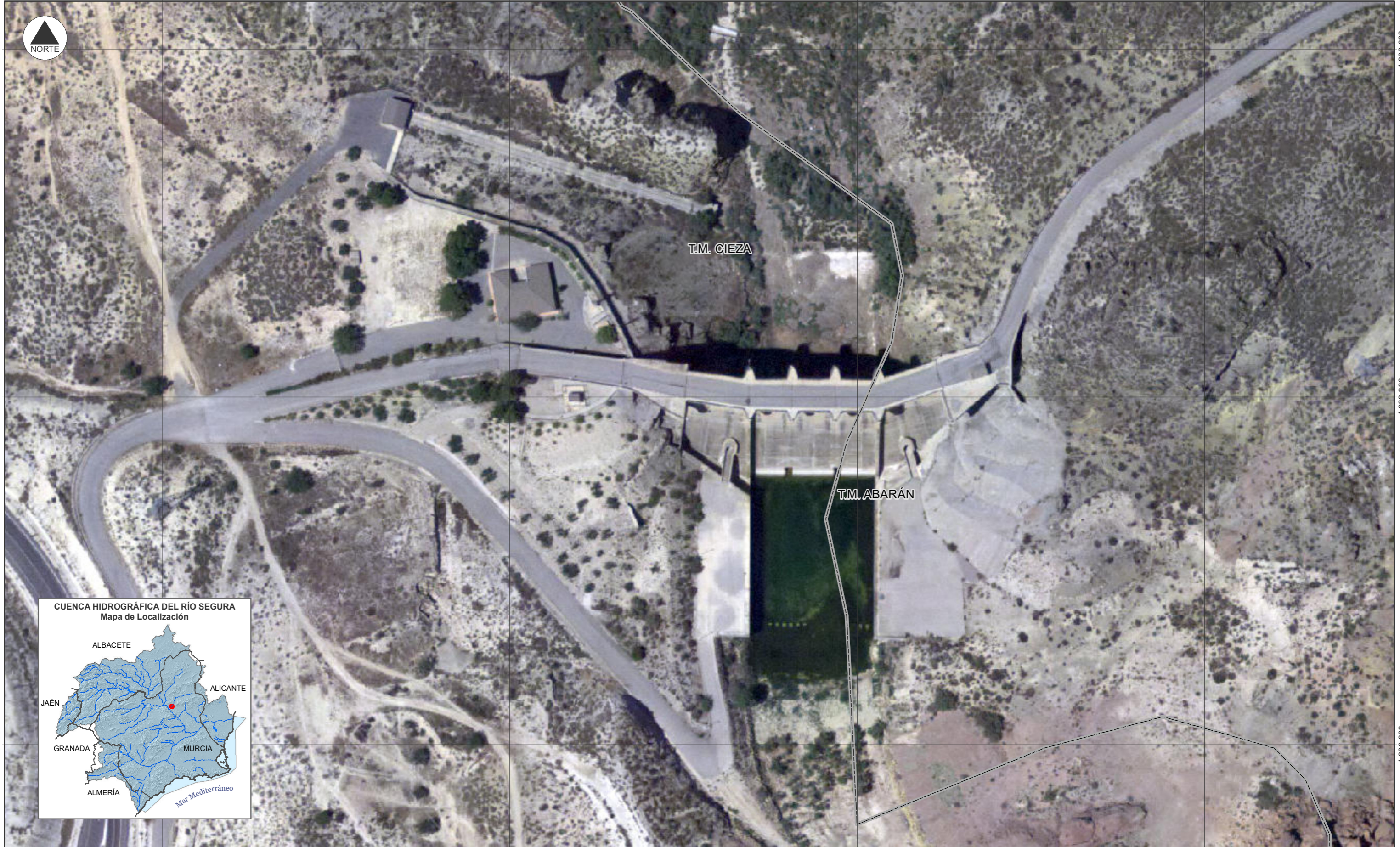
CUENCA HIDROGRÁFICA DEL RÍO SEGURA Mapa de Localización