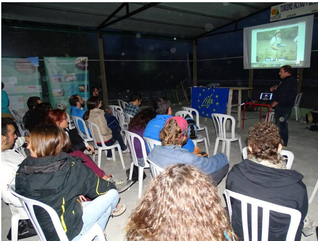
Charlas de formación de voluntarios con Río Rie