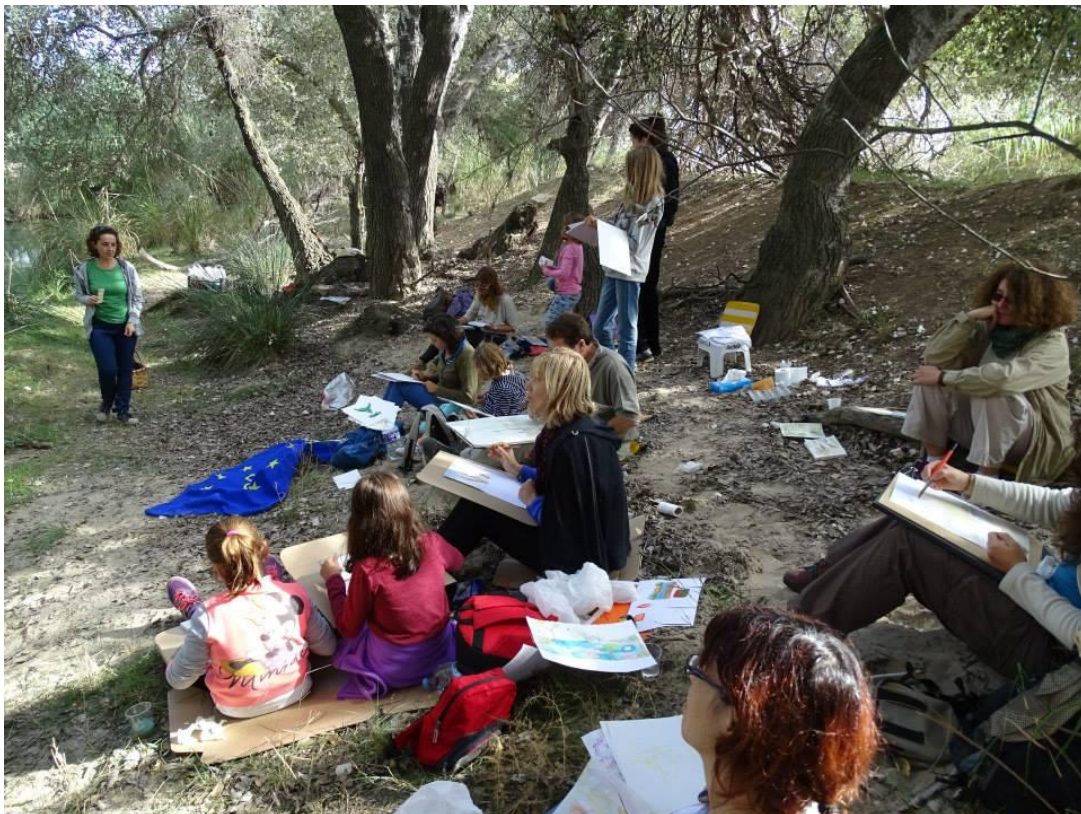
Pintura de paisaje riparios con voluntarios