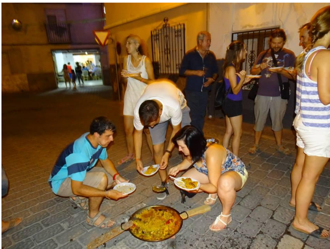
Participantes del campo de trabajo participando en el concurso de paellas de Calasparra

En el desarrollo del campo de Trabajo participará la Escuela de Piragüismo de Calasparra para la organización de actividades lúdico-deportivas en el medio natural.