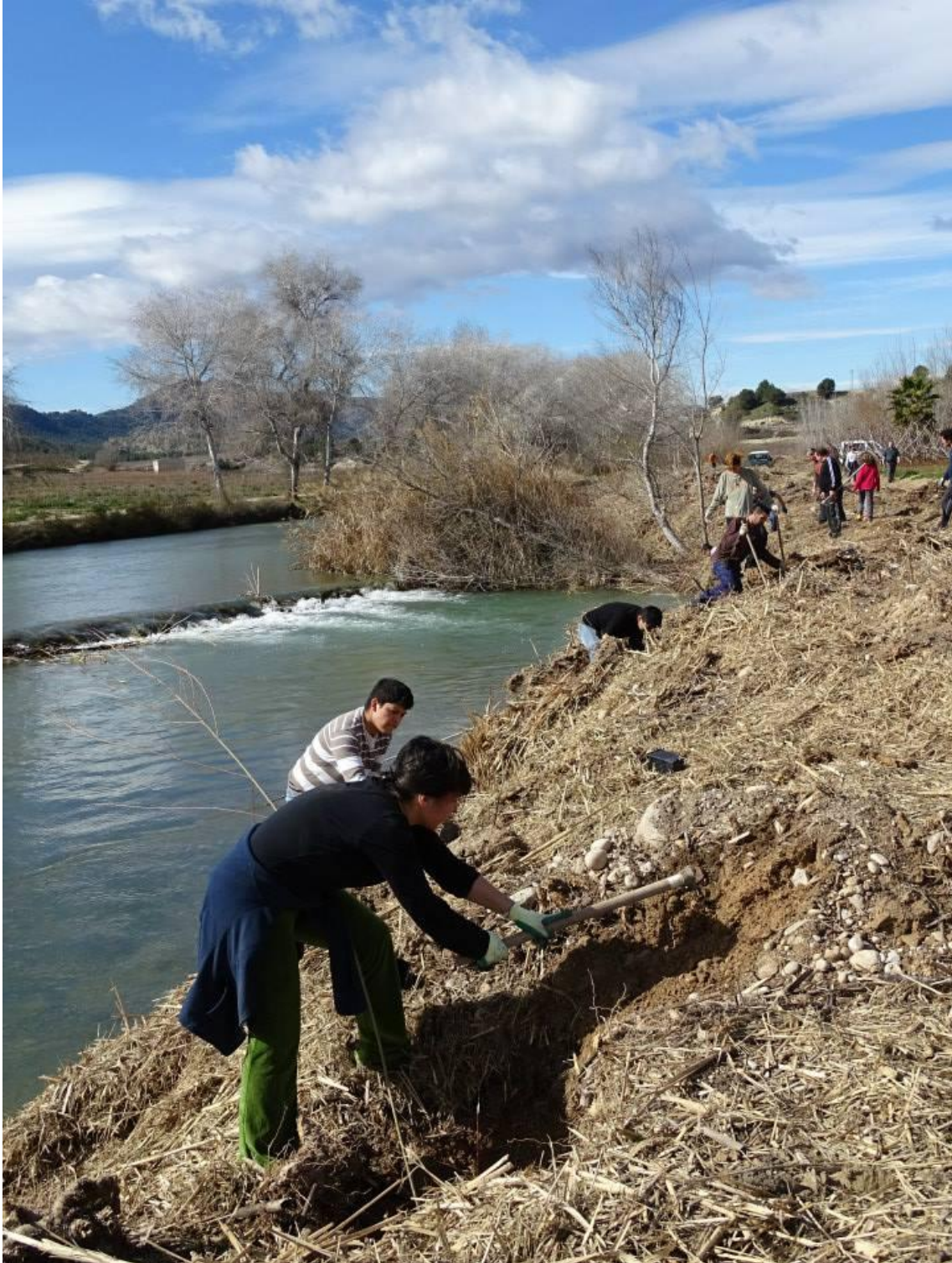
Plantación del Azud Los Charcos (Cieza) una de las zonas a realizar trabajos de mantenimiento del río