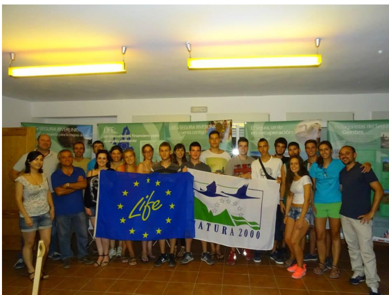
Grupo del campo de trabajo del año pasado con los técnicos de la CHS y miembros de ANSE

-Participación en acciones de divulgación del proyecto, incluyendo contacto con agricultores, regantes y asociaciones del área, talleres infantiles, etc.