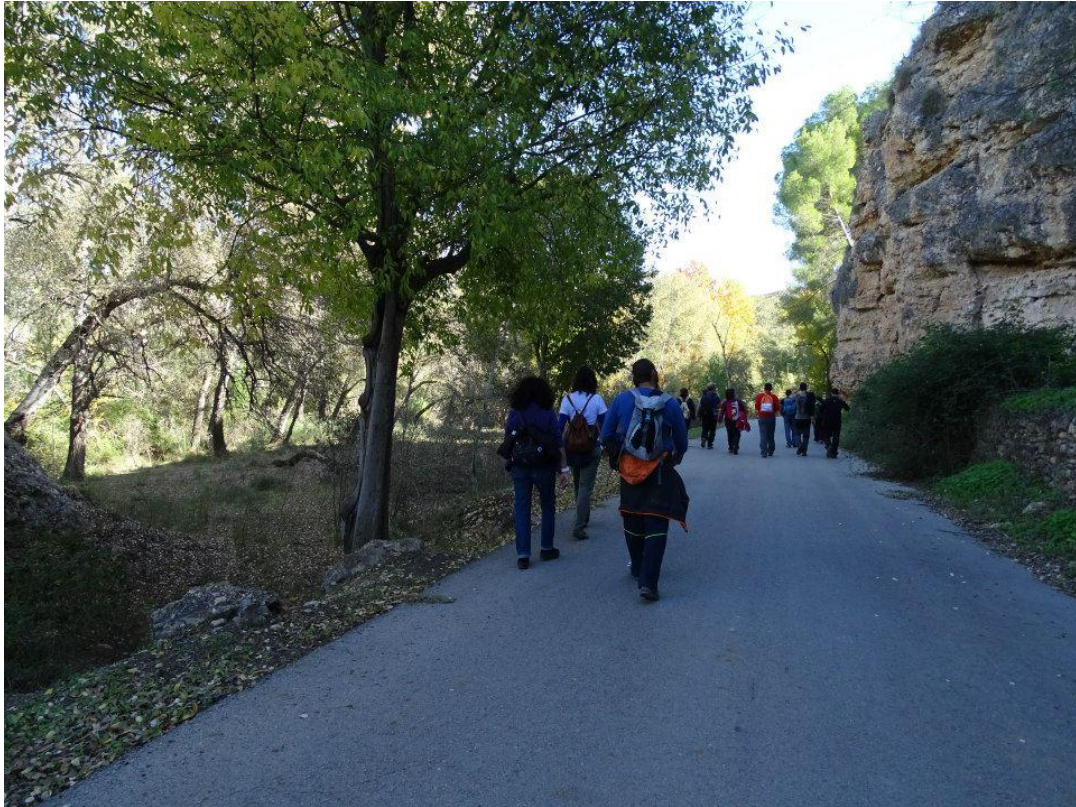
Ruta botánica por Cañaverosa con EarthPlan