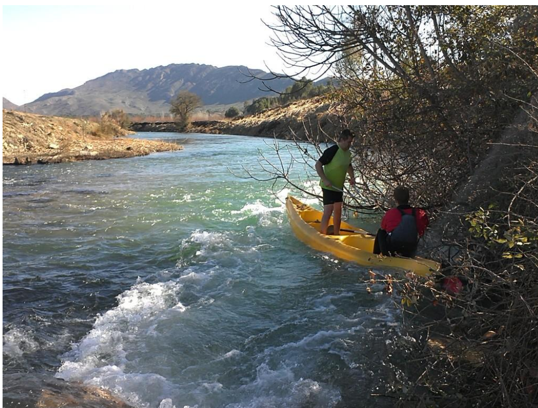
Voluntarios de la Escuela de Piragüismo de Calasparra