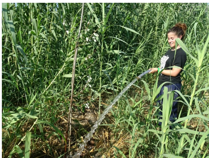
Voluntaria del año 2015 cuidando un álamo

Durante el verano de 2015 se desarrolló en el contexto del proyecto LIFE hermano SEGURARIVERLINK un campo de trabajo que permitió garantizar el arraigo de dos plantaciones de bosque de ribera situadas en Cieza y Calasparra.