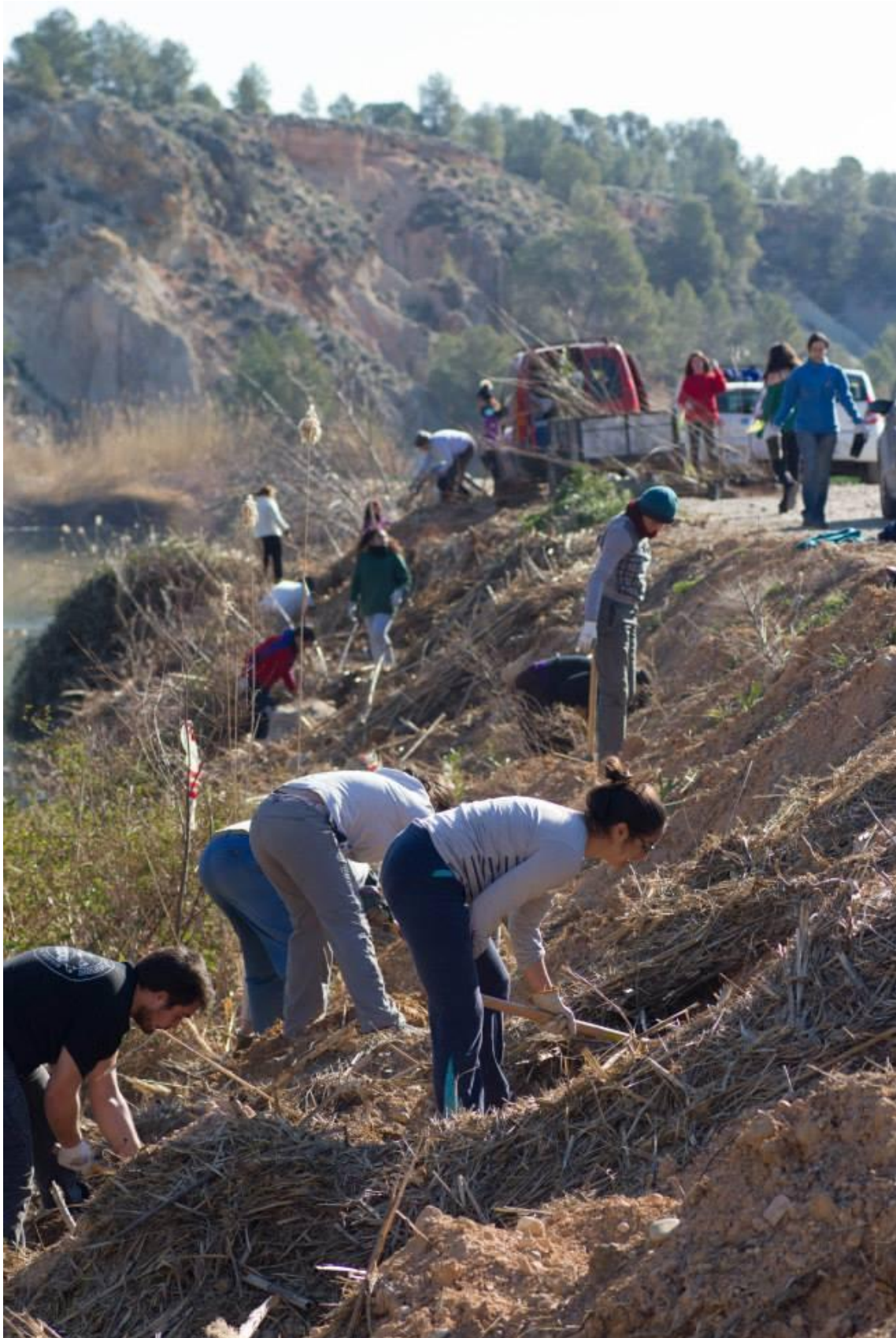
Plantación en la elevación post-trasvase (Calasparra) una zona a realizar trabajos de mantenimiento con los participantes