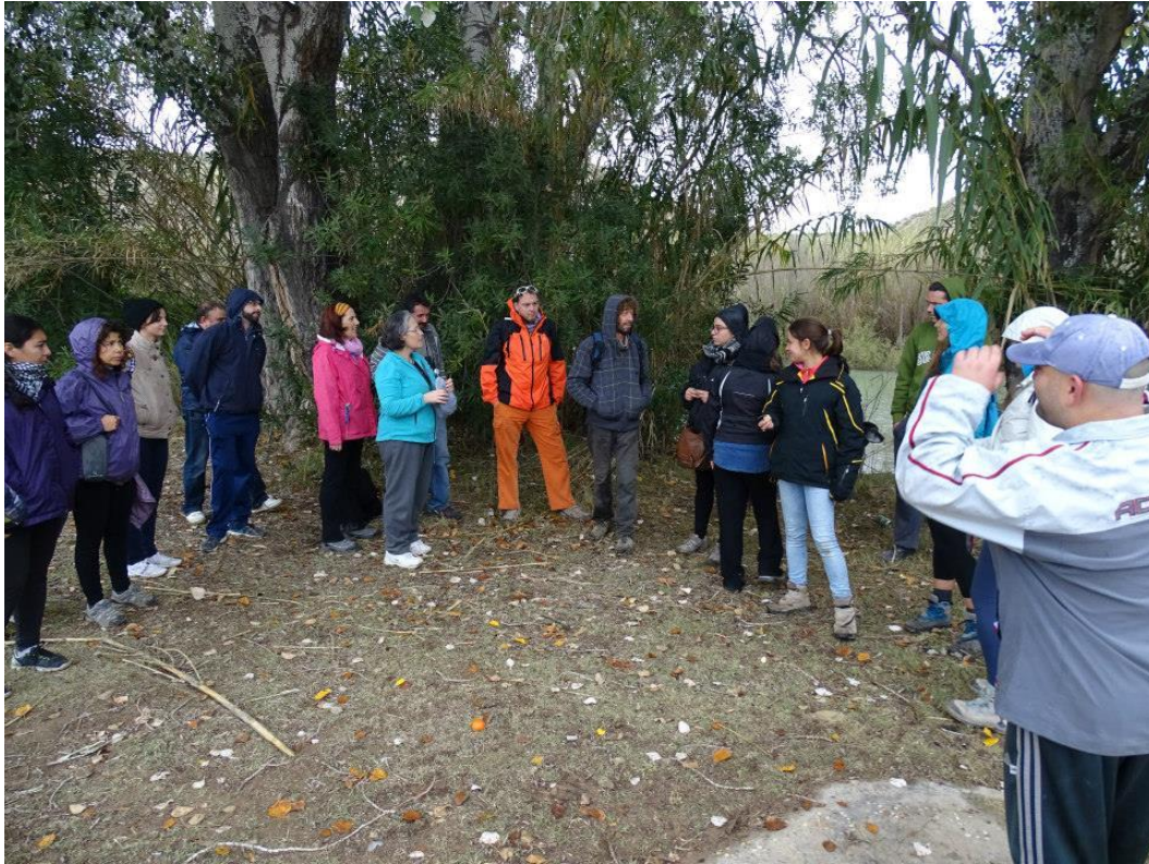
Descubriendo el río con la Asociación RíoRie