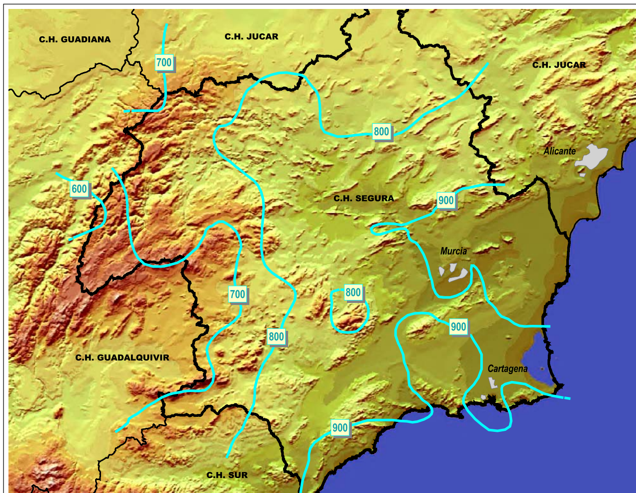
Evapotranspiración Potencial media anual (ETP mm/año)