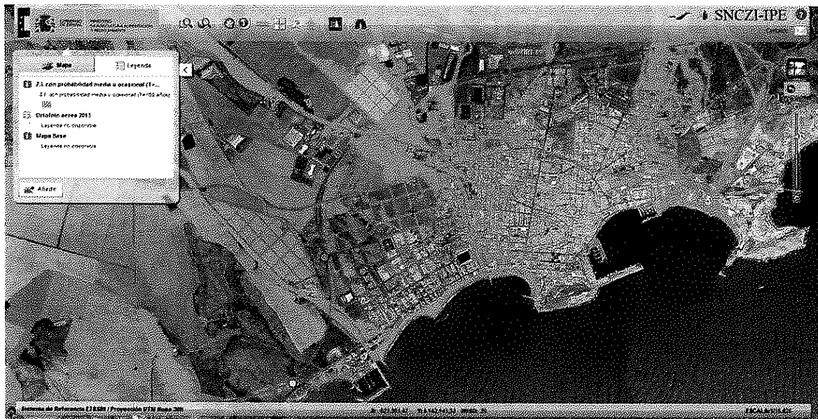
Áreas inundables de origen fluvial para T=100 años.