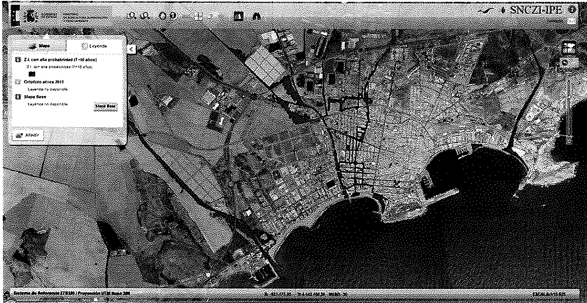
Áreas inundables de origen fluvial para T=10 años.