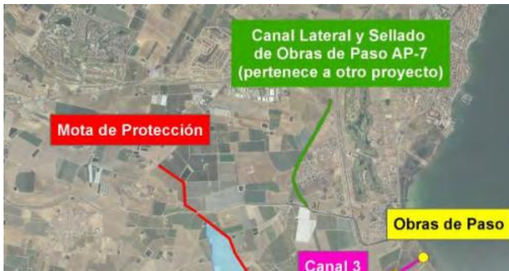
FIGURA 2. Detalle de la alternativa para la rambla del Albuji3n en el PGRI.

que todo el caudal aguas arriba de la misma descienda hasta la rambla y no se produzcan inundaciones dentro en la zona de Bahía Bella.”