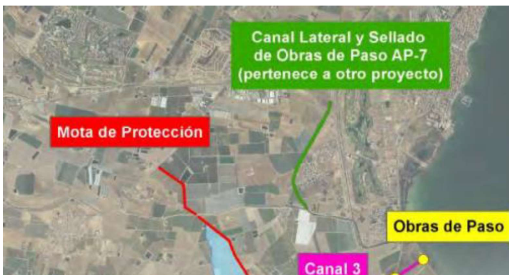
FIGURA 2. Detalle de la alternativa para la rambla del Albuñón en el PGRI.

...”Como actuaciones complementarias a las descritas, pero dentro del alcance de otro proyecto en redacción, se prevé la construcción de un canal paralelo a la carretera AP-7 que derive el caudal que aportan las ramblas del norte del municipio de Los Alcázares hacia el sur, de forma que desagüe al cauce existente de la rambla de Albuñón, añadiendo 67 m 3 /s. Como protección adicional se prevé la clausura de las obras de paso de la AP-7, de forma que todo el caudal aguas arriba de la misma descienda hasta la rambla y no se produzcan inundaciones dentro en la zona de Bahía Bella.”