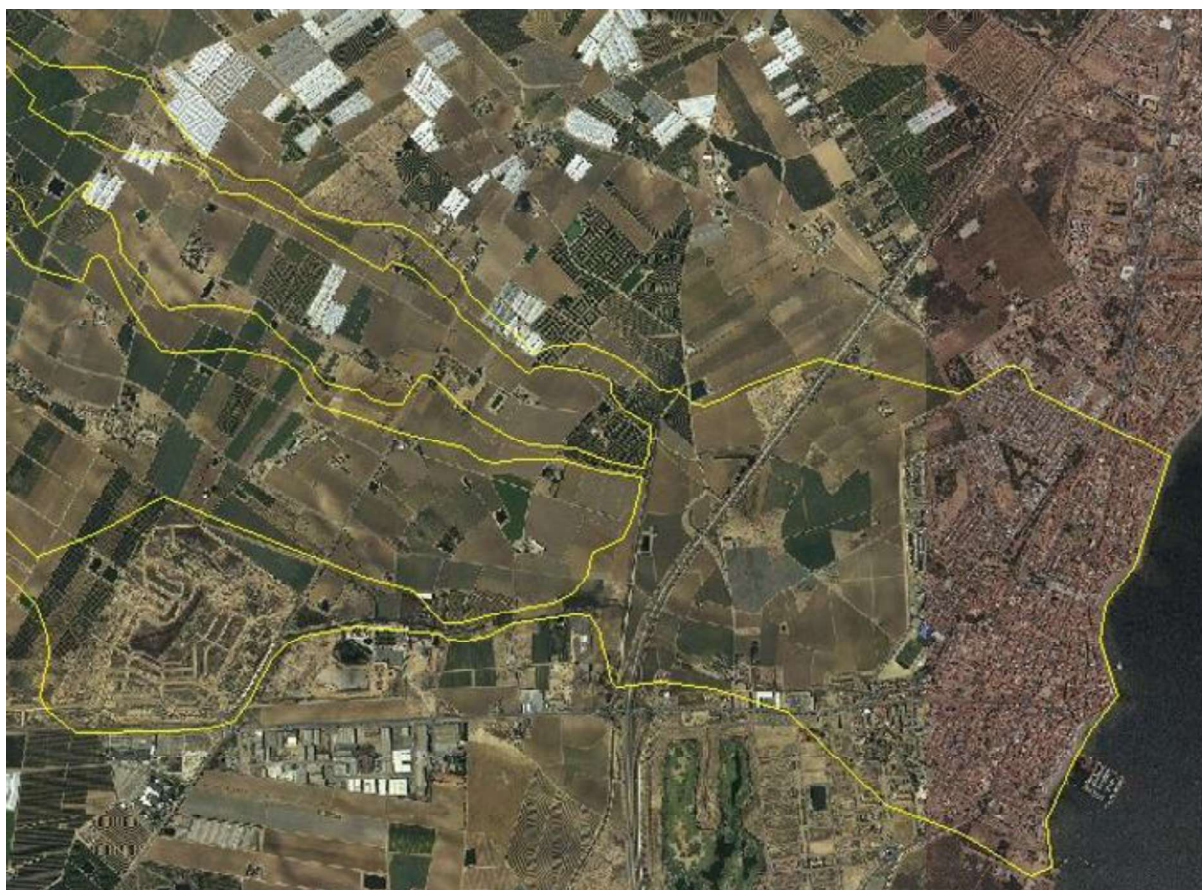
FIGURA 4. Detalle de ZFP de Maraña sin incluir flujos desbordados de La Colonia en Los Alcázares.

De esta cita cabe deducir que el planteamiento que presenta la propia CHS de la medida 1895 del PdM no ha sido suficientemente estudiado dada la situación que el propio encauzamiento del Albuñón, la configuración del trazado de la AP-7 y la propia configuración topográfica de la zona generarían a esta solución.