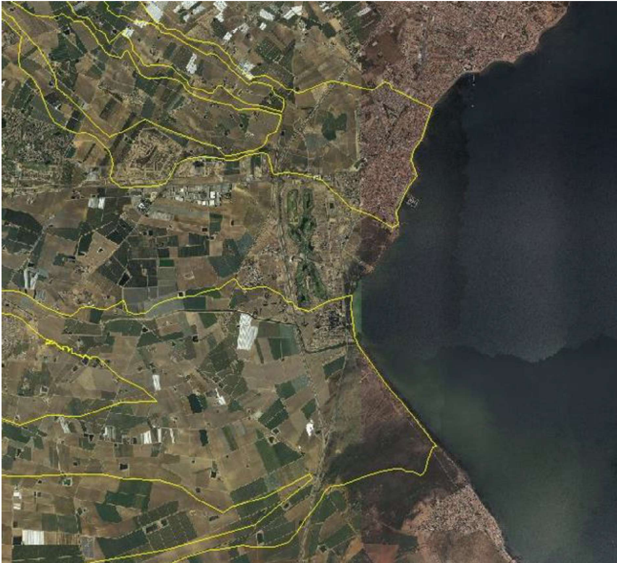
FIGURA 5. Zonas de flujo preferente de las ramblas de la Maraña y el Albuñón. Lomas de Rame no tiene afección de la rambla de la Maraña y apenas de la del Albuñón.