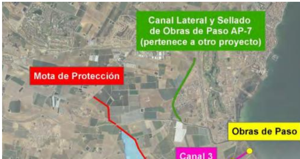
FIGURA 2. Detalle de la alternativa para la rambla del Albuji3n en el PGRI.

que todo el caudal aguas arriba de la misma descienda hasta la rambla y no se produzcan inundaciones dentro en la zona de Bahía Bella.”