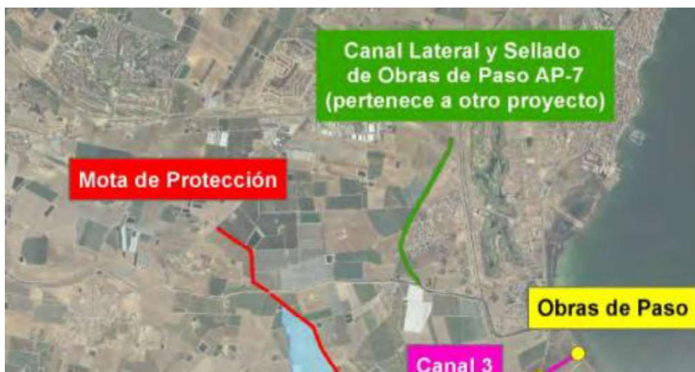
FIGURA 2. Detalle de la alternativa para la rambla del Albuñón en el PGRI.

que todo el caudal aguas arriba de la misma descienda hasta la rambla y no se produzcan inundaciones dentro en la zona de Bahía Bella.”