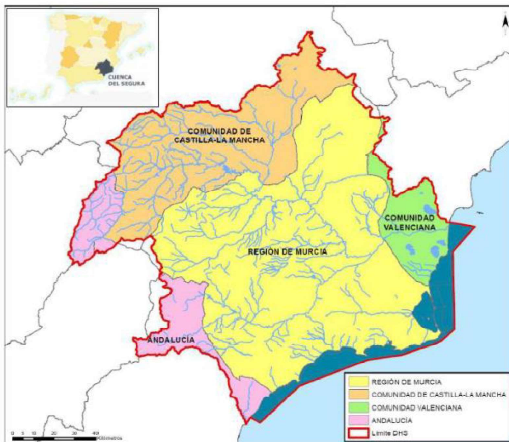
Ilustración 1 Ámbito Territorial CHS