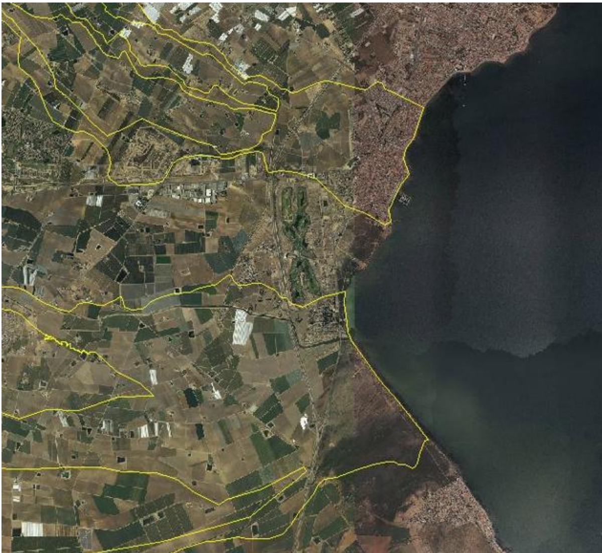
FIGURA 5. Zonas de flujo preferente de las ramblas de la Maraña y el Albuñón. Lomas de Rame no tiene afección de la rambla de la Maraña y apenas de la del Albuñón.

Esto ha hecho que la población de Las Lomas del Rame alarmada por las consecuencias que pudieran derivar de tales actuaciones se movilicen en contra de las mismas.