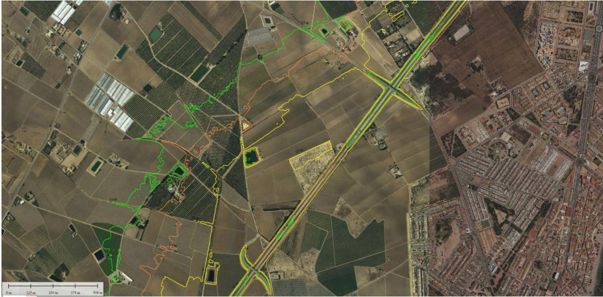
FIGURA 3. Líneas de nivel a cota 13, 14 y 15 metros

comentaba. El volumen de agua que va a generar este embolsamiento ha de ser muy importante y la afección aguas arriba, simplemente por la topografía del terreno, va a causar perjuicios llegando incluso al municipio de Torre-Pacheco. Además, como se comenta, no hace sino trasladar el problema a Lomas de Rame, Torre de Rame, Bahía Bella y demás zonas aledañas.