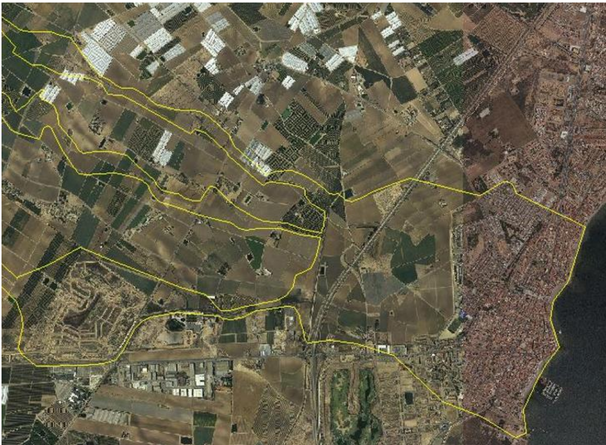
FIGURA 4. Detalle de ZFP de Maraña sin incluir flujos desbordados de La Colonia en Los Alcázares.

De esta cita cabe deducir que el planteamiento que presenta la propia CHS de la medida 1895 del PdM no ha sido suficientemente estudiado dada la situación que el propio encauzamiento del Albuñón, la configuración del trazado de la AP-7 y la propia configuración topográfica de la zona generarían a esta solución.