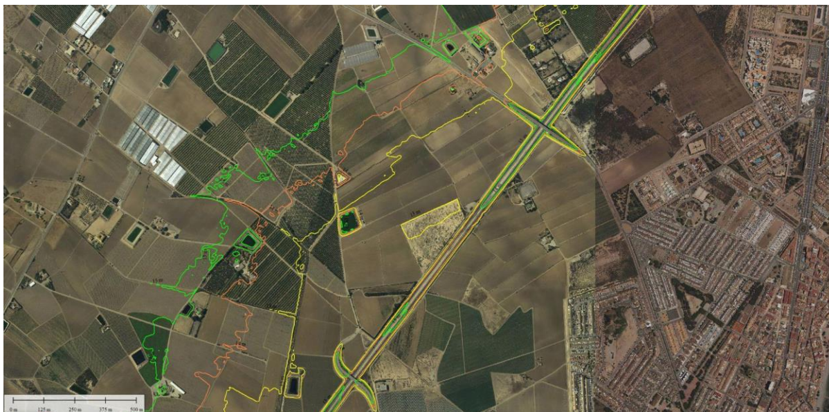
FIGURA 3. Líneas de nivel a cota 13, 14 y 15 metros

En la Memoria del PROYECTO PARA AUMENTAR LA CAPACIDAD HIDRÁULICA DEL DRENAJE AGRÍCOLA D-7 DEL CAMPO DE CARTAGENA. CANALIZACIÓN DE ESCORRENTÍAS EN LA AVENIDA FERNANDO MUÑOZ ZAMBUDIO Y ALEDAÑOS. T.M LOS ALCÁZARES (MURCIA), su punto 3.3 ESTUDIO DE SOLUCIONES cita literalmente: