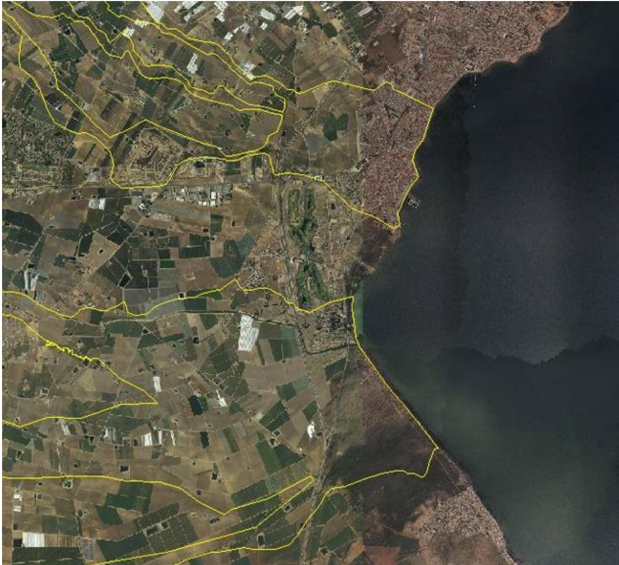
FIGURA 5. Zonas de flujo preferente de las ramblas de la Maraña y el Albuñón. Lomas de Rame no tiene afección de la rambla de la Maraña y apenas de la del Albuñón.