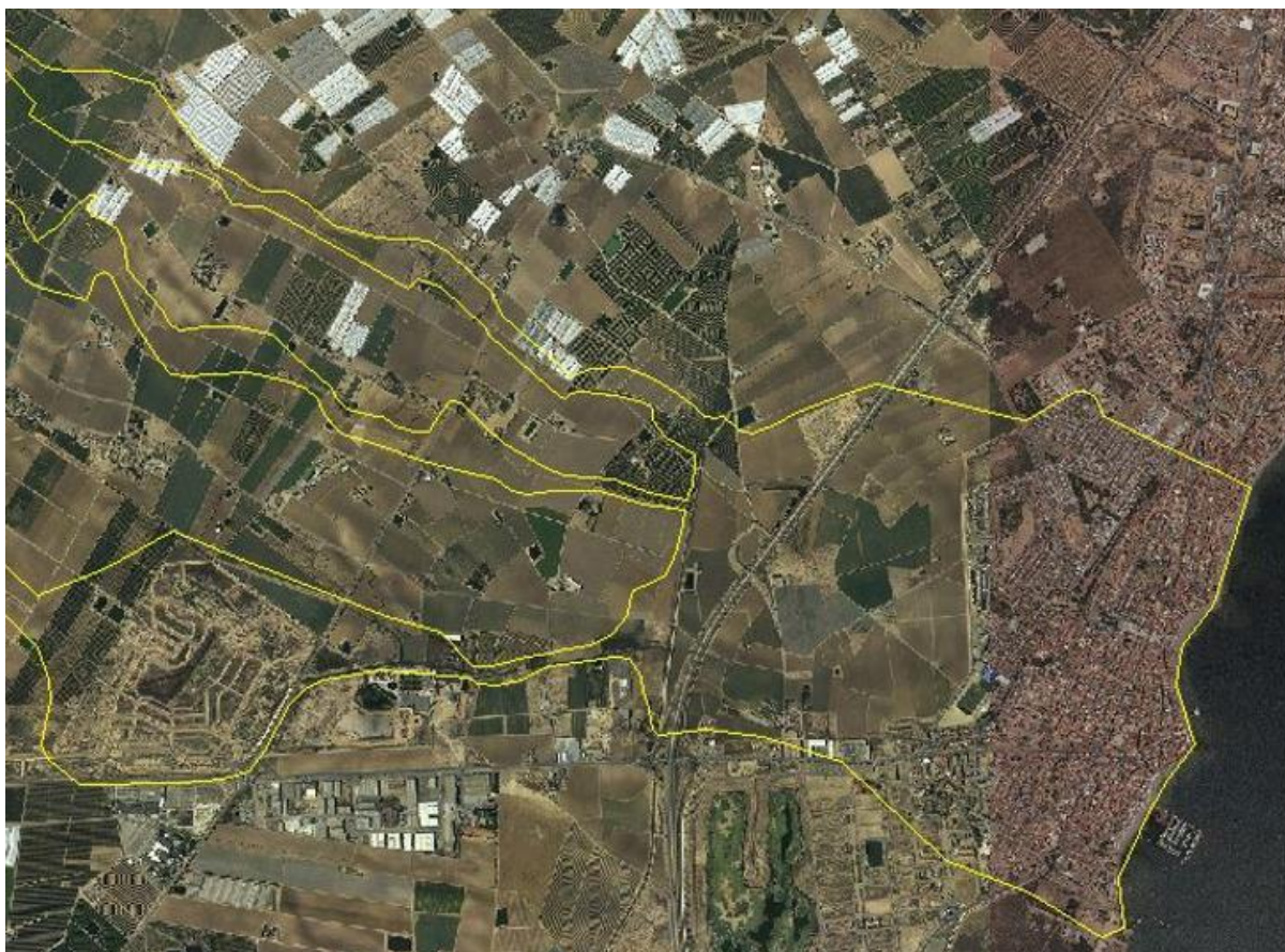
FIGURA 4. Detalle de ZFP de Maraña sin incluir flujos desbordados de La Colonia en Los Alcázares.

De esta cita cabe deducir que el planteamiento que presenta la propia CHS de la medida 1895 del PdM no ha sido suficientemente estudiado dada la situación que el propio encauzamiento del Albuñón, la configuración del trazado de la AP-7 y la propia configuración topográfica de la zona generarían a esta solución.