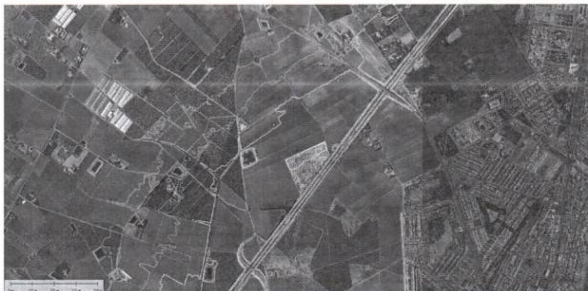
FIGURA 3. Líneas de nivel a cota 13, 14 y 15 metros

En la Memoria del PROYECTO PARA AUMENTAR LA CAPACIDAD HIDRÁULICA DEL DRENAJE AGRÍCOLA D-7 DEL CAMPO DE CARTAGENA. CANALIZACIÓN DE ESCORRENTÍAS EN LA AVENIDA FERNANDO MUÑOZ ZAMBUDIO Y ALEDAÑOS. T.M LOS ALCÁZARES (MURCIA), su punto 3.3 ESTUDIO DE SOLUCIONES cita literalmente: