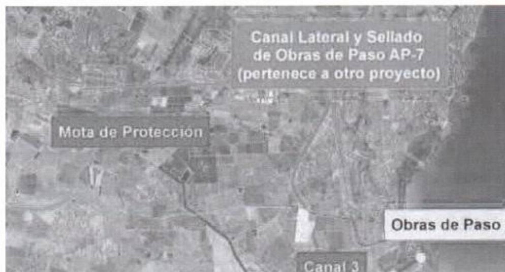
FIGURA 2. Detalle de la alternativa para la rambla del Albuñón en el PGRI.

que todo el caudal aguas arriba de la misma descienda hasta la rambla y no se produzcan inundaciones dentro en la zona de Bahía Bella.”