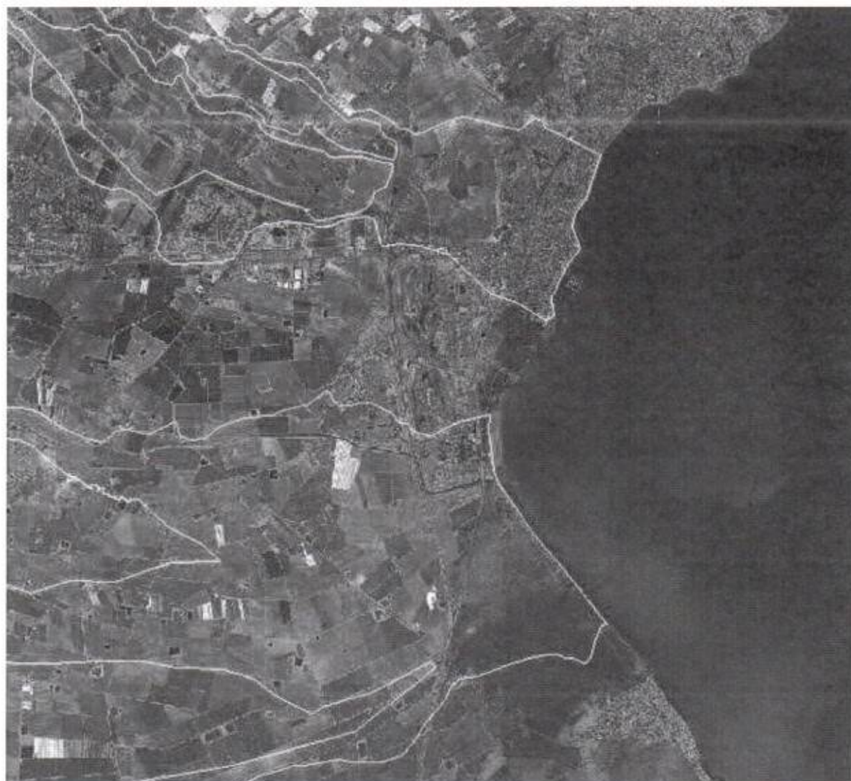
FIGURA 5. Zonas de flujo preferente de las ramblas de la Maraña y el Albuñón. Lomas de Rame no tiene afección de la rambla de la Maraña y apenas de la del Albuñón.