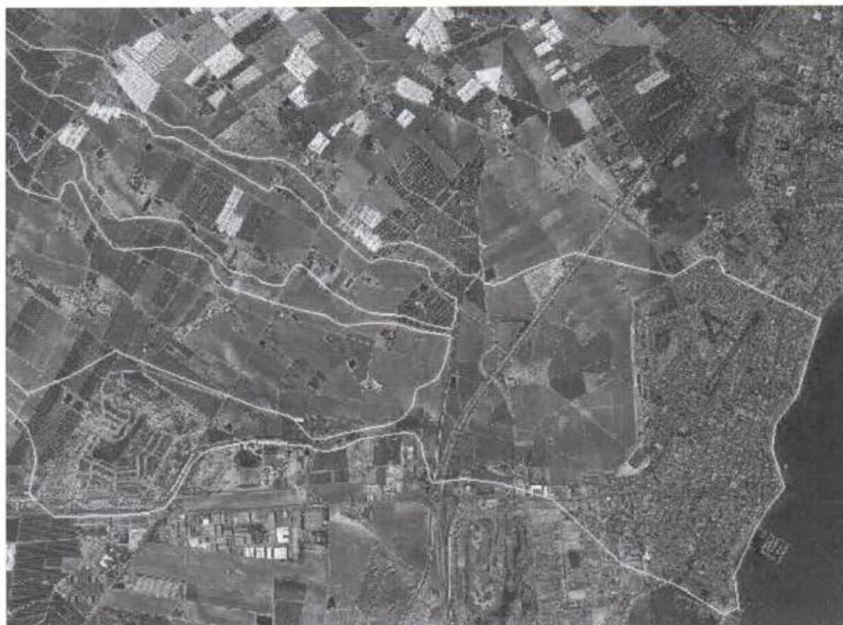
FIGURA 4. Detalle de ZFP de Maraña sin incluir flujos desbordados de La Colonia en Los Alcázares.

del Albuñón, la configuración del trazado de la AP-7 y la propia configuración topográfica de la zona generarían a esta solución.